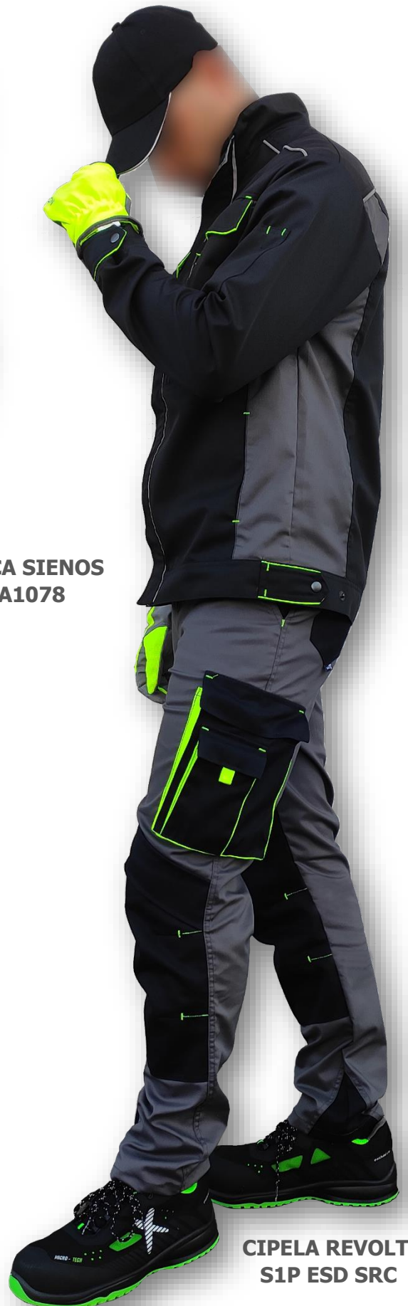
CIPELA REVOLT S1P ESD SRC