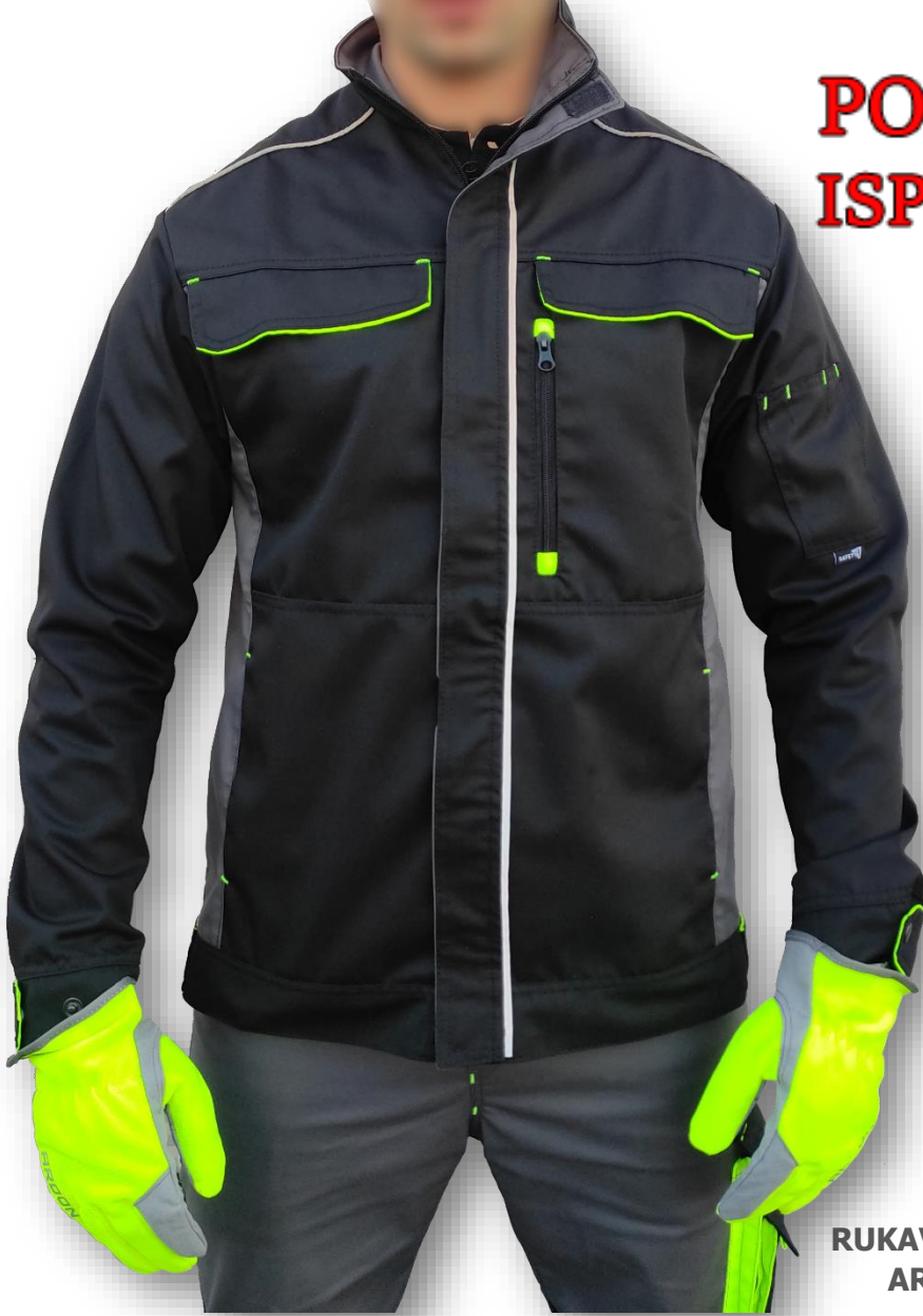
RUKAVICA SIENOS ART. A1078